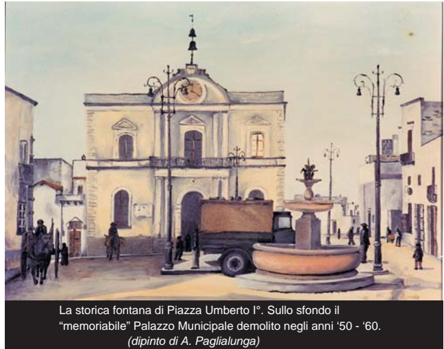
La storica fontana di Piazza Umberto I°. Sullo sfondo il "memoriabile" Palazzo Municipale demolito negli anni '50 - '60. (dipinto di A. Paglialunga)

Altra ipotesi, di tutto rispetto, sull'origine del nome "Veglie" è quella