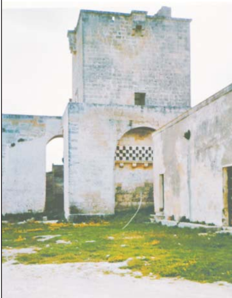
L'antica torre della Masseria Santa Chiara nel cuore dell'Arneo.

Arrivando ai giorni nostri, l'Arneo si presenta come un comprensorio pugliese che, pur intaccato da ancestrali problemi sociologici tipici del mondo rurale meridionale, vive un intenso momento di transizioni tra passato e presente, articolando il suo processo evolutivo, in corso, tra trasformazione fondiaria, insediamenti agrituristici e puro turismo lungo le coste. Ma soprattutto l'agricoltura, da sempre fonte di vita e di progresso delle genti d'Arneo, attraversa, seppur con tante difficoltà, un processo di trasformazione con esiti sociologici ancora non prevedibili. Nel microcosmo dell'Arneo, che conferisce al capitale umano, in termini che quantitativi sia qualitativi, le caratteristiche di fattore limitante un tempo riservate alle superfici o alle scorte, l'analisi della vicenda produttiva si rivela infruttuosa se condotta solo sotto il profilo economico. "Non esistono imprese e fondi, esistono uomini i quali creano e ricreano imprese e fondi". Nell'Arneo queste parole einaudiane, nobilmente morali, si rivelano, anche, di sagace avvertimento sociologico: l'azienda agricola o turistica è il suo protagonista perché gli uomini fanno quello che sono, perché l'albero si riconosce dai frutti. La produzione? Sono i produttori. Se la produzione è potenzialmente racchiusa nei produttori, come il frutto nei semi, la teoria dei modelli culturali apre la strada ad una serie di felici, perché elementari quantificazioni